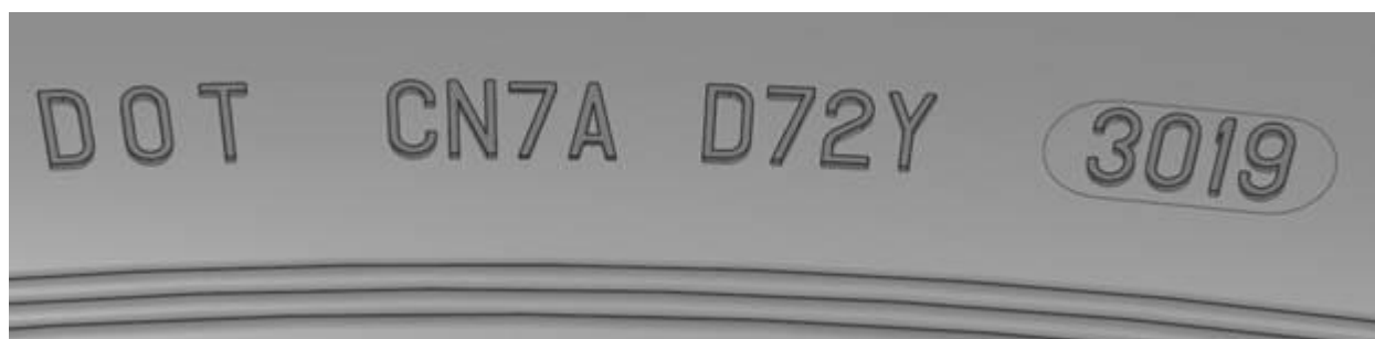
Grafik: Komplette DOT-Nummer und Produktionswochencode 3019